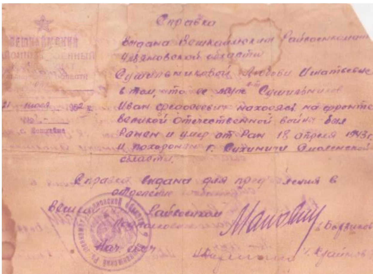
Справка Вешкаймского Райвоенкомата Ульяновской области