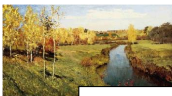
И. Левитан «Золотая осень», «Над вечным покоем».