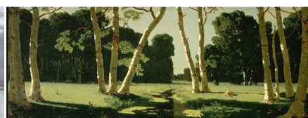
А. Куинджи «Березовая роща».