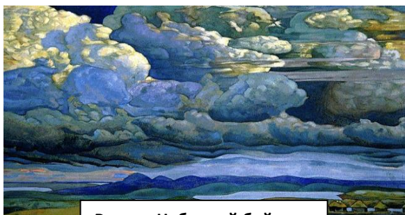
Рерих «Небесный бой».