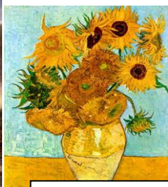
Винсент ван Гог «Подсолнухи».