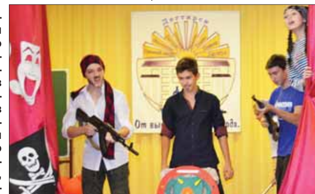
Задорная команда «Пираты двадцатого века»

По ходу КВНа команды участвовали в викторине по истории российского кино. А в конкурсе капитанов члены команды угадывали по пантомимам своего лидера название фильмов. Капитанам пришлось нелегко, пришлось использовать свою находчивость по полной! Закончилось состязание по-