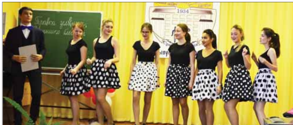
Очаровательная команда «Стиляги»

В конце прошлой недели в актовом зале школы №16 яблоком негде было упасть. Ещё бы – КВН, посвященный году российского кино. Встречались в клубе веселые и находчивые команды выпускников и десятиклассников, а вернее – «Стиляги» и «Пираты двадцатого века». Какая-то команда была признана самой сплоченной и дружной, а другая – самой позитивной, поразив всех своим стилем, юмором и обаянием!